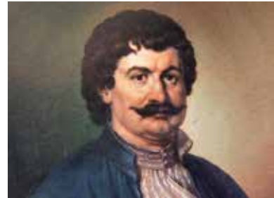
Ρήγας Φεραίος (1757–1798)

Ο Ρήγας Φεραίος, διανοούμενος και συγγραφέας του Νεοελληνικού Διαφωτισμού, επηρεασμένος από τη Γαλλική Επανάσταση του 1789, έγινε γνωστός για την επαναστατική του δράση και το όραμά του για ελευθερία. Οραματίστηκε την απελευθέρωση των λαών των Βαλκανίων από την οθωμανική κυριαρχία και την ίδρυση μιας δημοκρατικής πολιτείας. Έγραψε επαναστατικά κείμενα, όπως ο «Θούριος» και η «Χάρτα της Ελλάδος». Τον Δεκέμβριο του 1797 συνελήφθη στην Τεργέστη από τις αυστριακές αρχές, παραδόθηκε στους Οθωμανούς και εκτελέστηκε στο Βελιγράδι τον Ιούνιο του 1798. Οι ιδέες του επηρέασαν βαθιά την Ελληνική Επανάσταση του 1821 και παραμένουν ζωντανές στη συλλογική μνήμη.