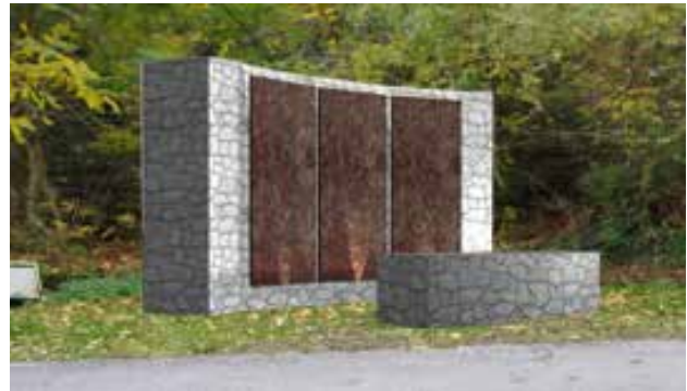
Η μακέτα του Μνημείου

Η Παρασκευή 4 Δεκεμβρίου 1942 ήταν μία ημέρα χαράς (ή τουλάχιστον ανακούφισης) για την Καλοσκοπή. Την ημέρα αυτή αφέθηκαν ελεύθεροι οι άνδρες του χωριού μας, οι οποίοι κρατούνταν ως όμηροι από τις Ιταλικές Δυνάμεις Κατοχής από τις 28 Σεπτεμβρίου 1942 σε στρατόπεδο της Θήβας.