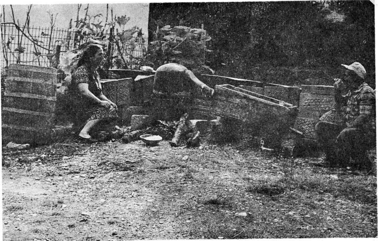
Τα ρακοκάζανα σε λειτουργία. Μας είναι άγνωστα τα πρόσωπα της φωτογραφίας.

Ο άνθρωπος του χωριού μας τώρα τυποποιήθηκε. Οι παλιές εκείνες εικόνες έχασαν το χρώμα τους και την παραδοσιακή τους γοητεία. Τώρα έγιναν μύθος, και μάλιστα βαρετός για τους νέους.