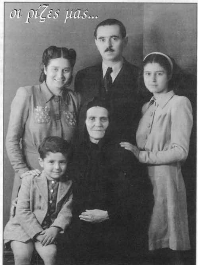
Από το προγονικό δένδρο των Κολιαίων:

ΗΛ. Σελιδοποίηση - Εκτύπωση - Βιβλιοδεσία ΑΝΤΩΝΙΑΔΗΣ ΑΒΕΕ ΓΡΑΦΙΚΩΝ ΤΕΧΝΩΝ Μ. ΑΛΕΞΑΝΔΡΟΥ 24 • ΤΗΛ. 5227552