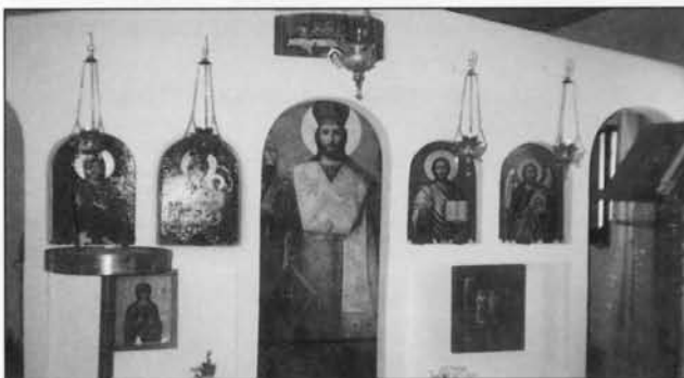
Το τέμπλο της Αγίας Παρασκευής, ύστερα από την ανακαίνισή του.

Το τριήμερο στην αγορά βρέθηκε πολύς κόσμος, ακόμη και από τα γύρω χωριά. Οι μερακλήδες χόρεψαν τσάμικο και καλαματιανό, αλλά δεν μπορούμε να πούμε ότι τους ικανοποίησε η φτωχή ορχήστρα. Το κλαρίνο ήταν ικανοποιητικό, αλλά οι τραγουδιστές δεν κατόρθωσαν να ανάψουν τα "αίματα", σε μας μάλιστα, τους ηλικιωμένους.